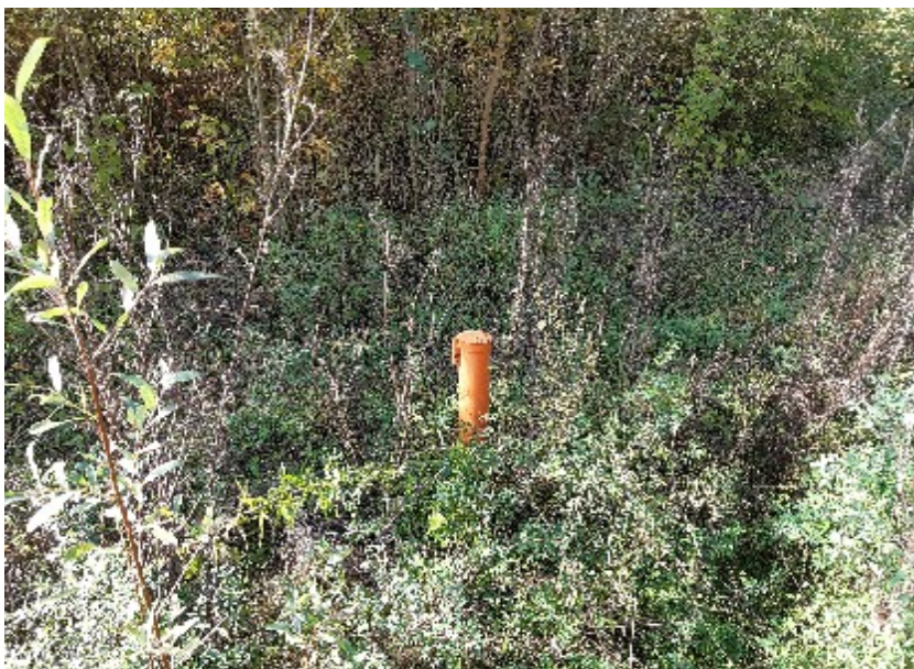
Photo du point de prélèvement